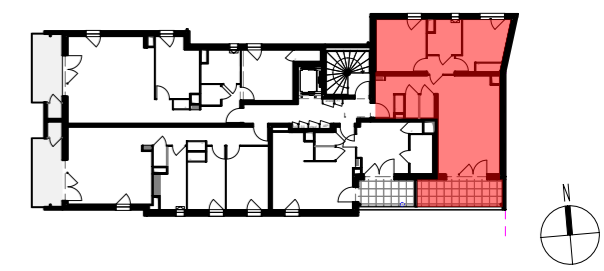
PLAN DE REPERAGE, Bâtiment - ech. 1/500