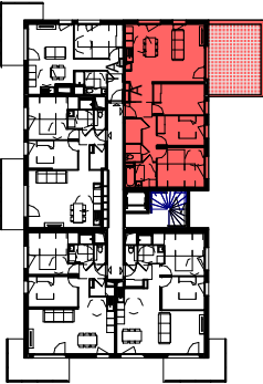
PLAN DU BATIMENT