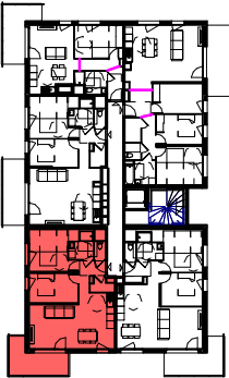
PLAN DU BATIMENT