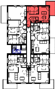
PLAN DU BATIMENT