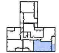
Plan intérieur (m. 1/250) Plan global (m. 1/500)